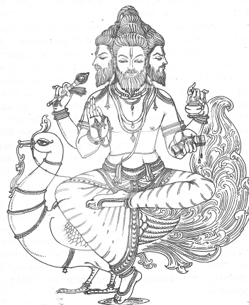
Fig. 5. Brahmā

Dans cet article, nous allons nous concentrer sur Brahma granthi et aborder les autres dans les suivants.